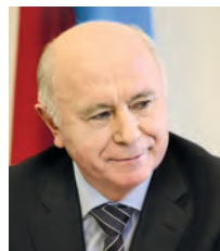
Николай Меркушкин, ГУБЕРНАТОР САМАРСКОЙ ОБЛАСТИ.

В заключение встречи Николай Меркушкин подчеркнул, что только при создании мощной научной и производственной базы экономика Самарской области сможет развиваться и не отставать от других регионов нашей страны.