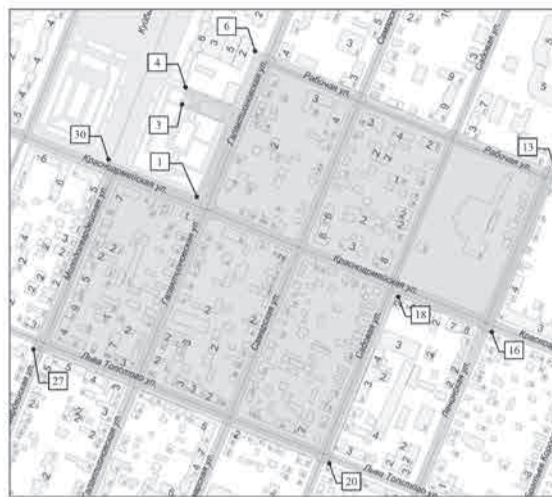
СХЕМА границ территории для подготовки документации по планировке территории в границах улиц Молодогвардейской, Красноармейской, Галактионовской, Рабочей, Ленинской, Красноармейской, Садовой, Льва Толстого в Ленинском районе городского округа Самара