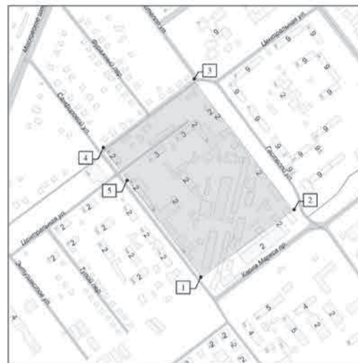
СХЕМА границ территории для подготовки документации по планировке территории в границах улицы Санфировой, улицы Центральной, улицы Гастелло, проспекта Карла Маркса в Октябрьском районе городского округа Самара