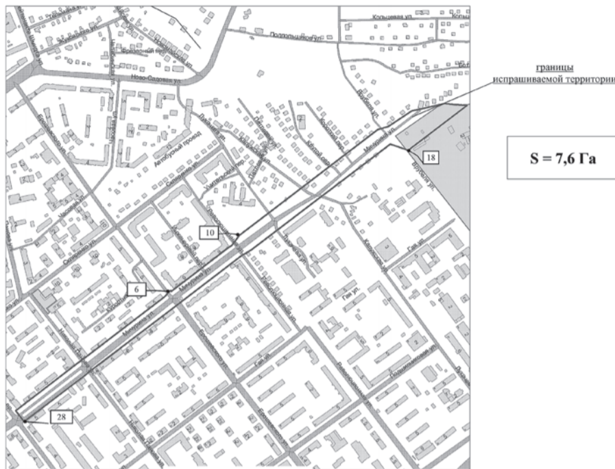
СХЕМА границ территории для подготовки документации по планировке территории в городском округе Самара в целях размещения линейного объекта «Реконструкция улицы Мичурина от проспекта Масленникова до магистрали в продолжение улицы Авроры в Октябрьском районе городского округа Самара

ПРИМЕЧАНИЕ: графический материал действителен только для подготовки распоряжения на проектирование