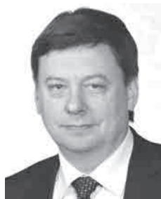
Олег Фурсов, ГЛАВА АДМИНИСТРАЦИИ ГОРОДСКОГО ОКРУГА САМАРА:

Я от всей души поздравляю с этим прекрасным праздником тех, кто только делает первые шаги к совместному будущему, и тех, чьи чувства уже проверены временем. Успехов вам, добра, счастья и гармонии! Пусть самые близкие люди всегда будут рядом, и пусть их любовь сподвигает вас на новые свершения и победы!