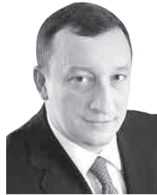
Александр Фетисов, ПРЕДСЕДАТЕЛЬ ДУМЫ ГОРОДСКОГО ОКРУГА САМАРА: