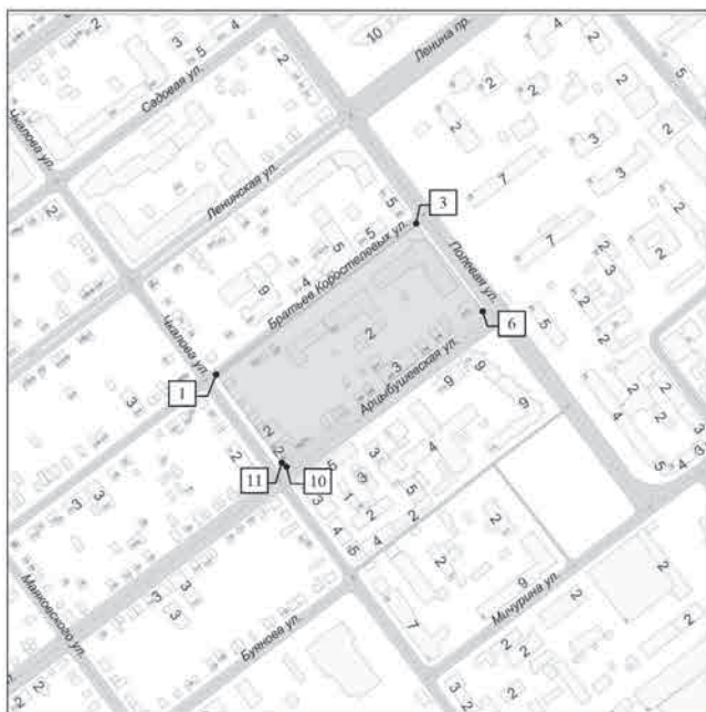
СХЕМА границ территории для подготовки документации по планировке территории в границах улиц Полевой, Арцыбушевской, Чкалова, Братьев Коростелевых в Ленинском районе городского округа Самара

ПРИЛОЖЕНИЕ № 1 к распоряжению Департамента строительства и архитектуры городского округа Самара 09.07.2015 № РД-707