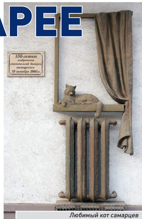
Любимый кот самарцев

Предложите свой вариант, присылайте фото и видео!