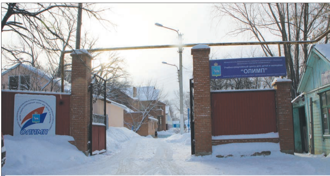
Вместо олимпийских чемпионов прежняя администрация хотела выращивать здесь яблоны и груши