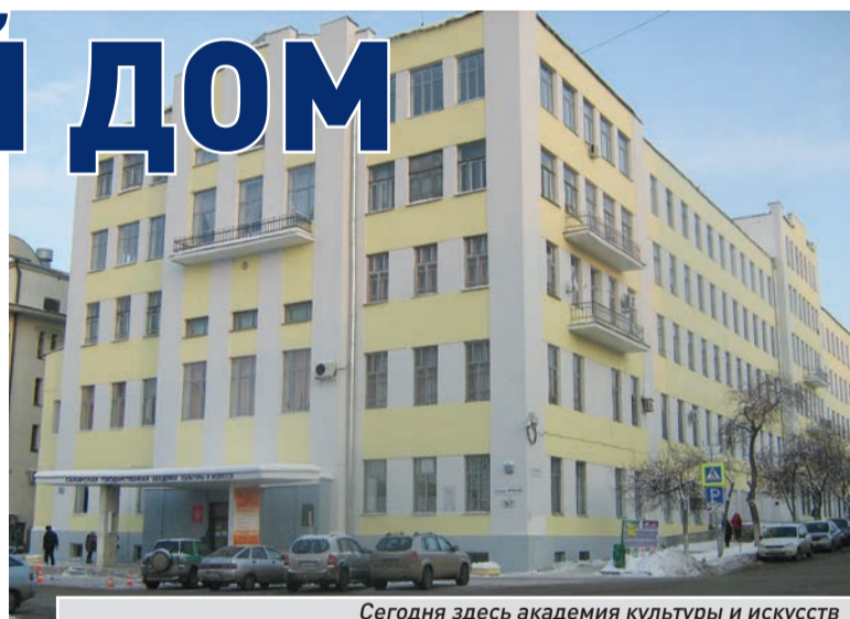
Сегодня здесь академия культуры и искусств

При этом он нарушал стандарты монументальной пропаганды. Например, в волжских городах все памятники разворачивали лицом к Волге. Наш Чапаев почему-то