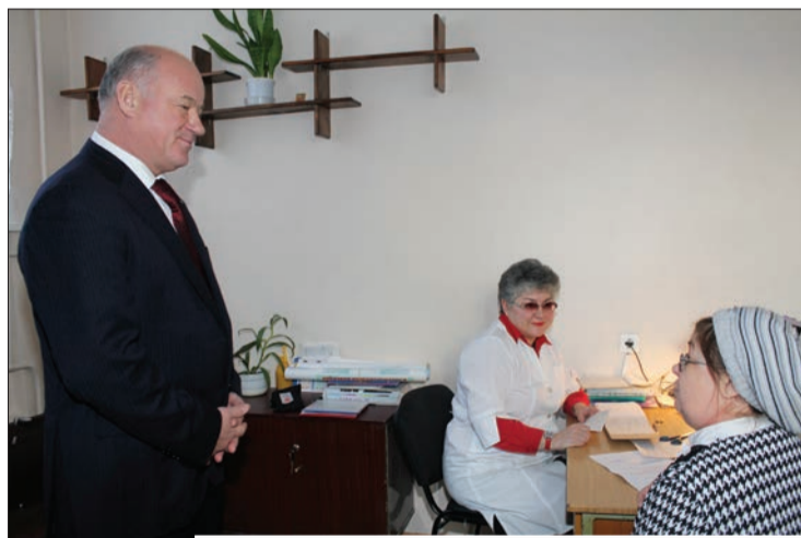
Теперь и работать, и лечиться здесь приятнее!

В рамках программы модернизации в этом году в Самаре отремонтировано 49 лечебных учреждений, и только в Кировском районе на ремонт и приобретение нового оборудования выделено 140 миллионов рублей. Сейчас идет активное освоение этих средств в МСЧ №5, горполиклинике №4, гор-