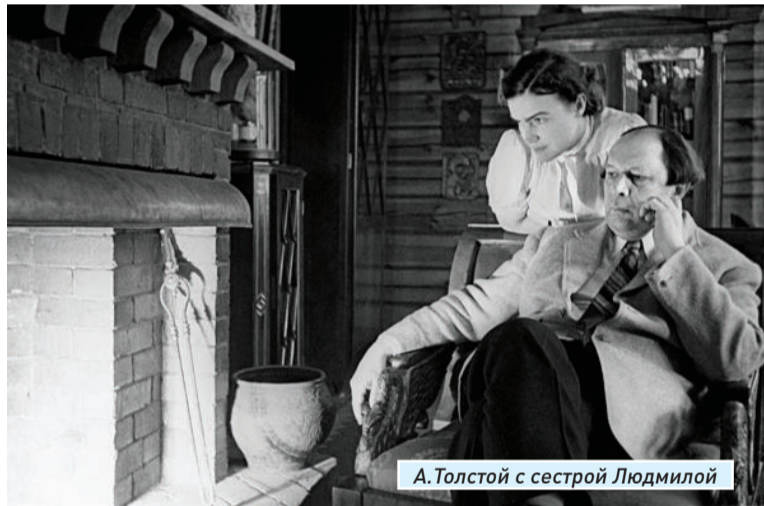
А. Толстой с сестрой Людмилой