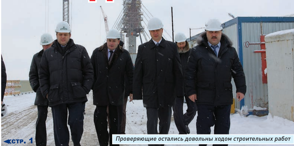
Проверяющие остались довольны ходом строительных работ