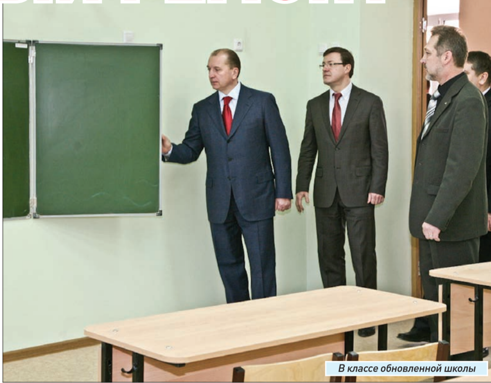
В классе обновленной школы

К тому же родители попросили у властей создать на Управленческом молодежный центр. Дмитрий Азаров обещал продумать варианты. Таким центром в будущем вполне мог бы стать физкультурно-оздоровительный комплекс или другие спортивные сооружения.