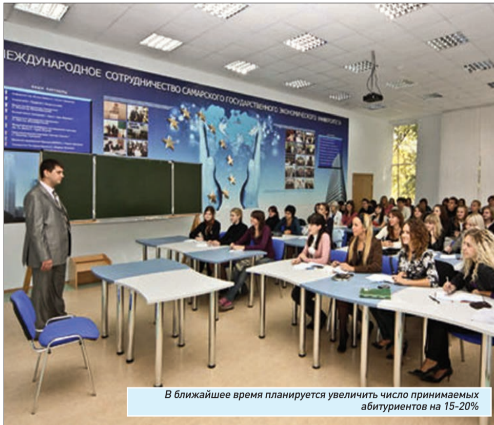
В ближайшее время планируется увеличить число принимаемых абитуриентов на 15-20%

Между тем некоторые представители главного профильного учебного заведения города – Самарского государственного экономического университета – сетуют, что в настоящий момент специалисты этой отрасли в России невостребованы. «Настойчиво повторяется тезис о низком качестве подготовки и вообще о перепроизводстве экономистов и юристов, менеджеров. Отсюда и политика перераспределения контрольных цифр бюджетного приема. Львиная доля идет в технические вузы. И самый последний факт несколько иного порядка – только что Правительство РФ утвердило перечень профессий, необходимых при