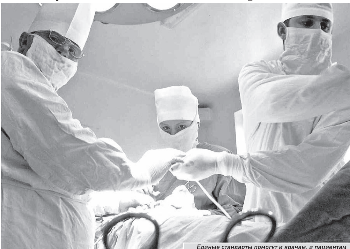
Единые стандарты помогут и врачам, и пациентам

- Платные услуги ввел еще Закон об обязательном медстраховании 1993 года, с этого времени муниципальное здравоохранение по нему и работает. Новый закон платные услуги оставляет, но предоставляет для их оказания более цивилизованные условия. На сегодняшний день практически все лечебные учреждения Самары оказывают платные услуги. Но основное условие: они не должны заменить бесплатную медпомощь, которая гарантирована системой обязательного медицинского страхования. Платные медуслуги — только дополнение к бесплатным. Прежде чем дать разрешение, департамент здравоохранения проверяет все виды и условия оказания этих платных услуг. Чтобы не было: кто бесплатно — сиди в очереди, кто платно — заходи. Мы с этим серьезно боремся. Для платных услуг должны быть отдельные кабинеты, отдельное время и, желательно, отдельное помещение (отделение или даже здание). Это дополнительный вид помощи,