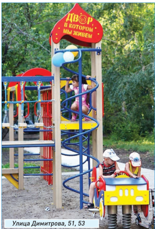
Улица Димитрова, 51, 53