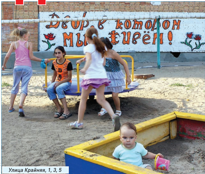
Улица Крайняя, 1, 3, 5