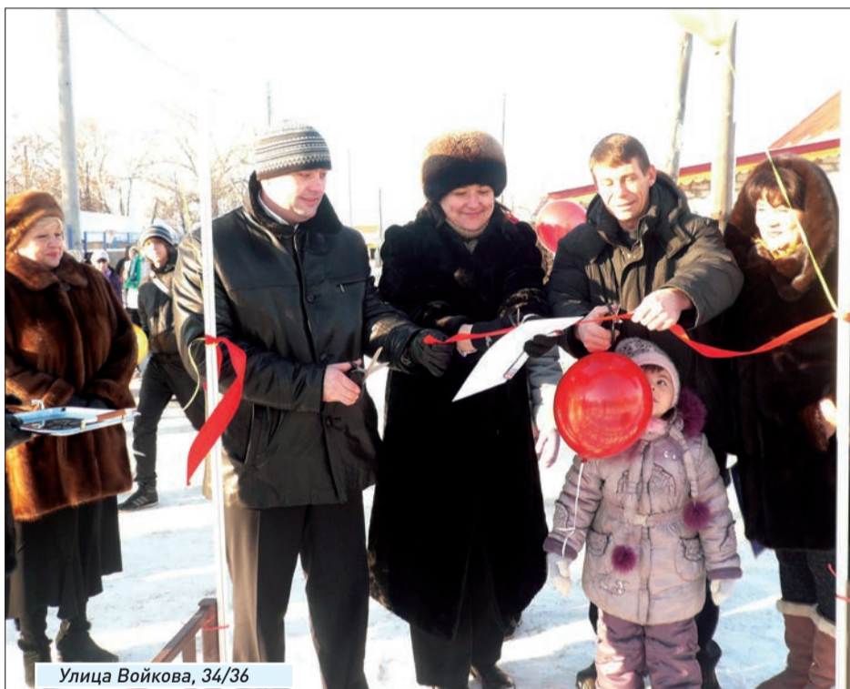
Улица Войкова, 34/36