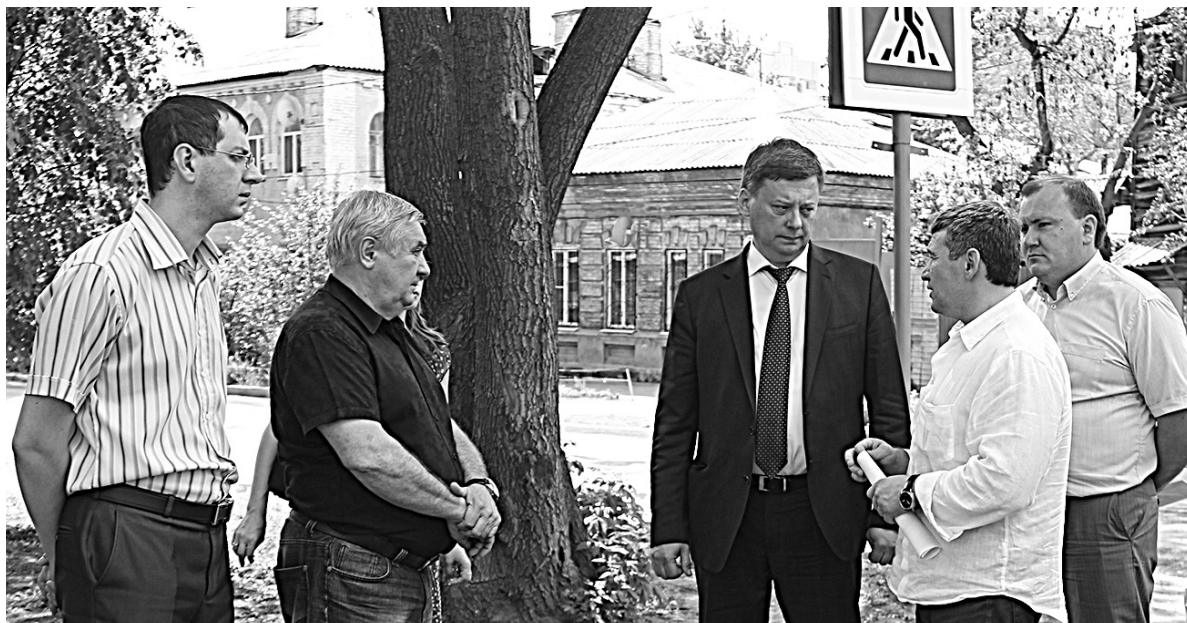
Объекты улично-дорожной сети городского округа Самара, в отношении которых разрабатывается проектно-сметная документация