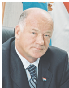
Виктор Сазонов, ПРЕДСЕДАТЕЛЬ САМАРСКОЙ ГУБЕРНСКОЙ ДУМЫ:

От всей души желаю вам счастья, благополучия, поддержки близких и уверенности в завтрашнем дне! Пусть в вашем доме всегда царят тепло, взаимопонимание и радость!