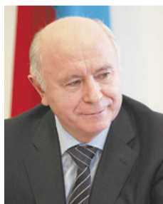
Николай Меркушкин, ГУБЕРНАТОР САМАРСКОЙ ОБЛАСТИ:

Сегодня в центре «МТЛ-Арена» в 13.00 пройдет торжественное мероприятие, приуроченное к Международному дню инвалида. Здесь состоится вручение именных премий губернатора Самарской области людям с ограниченными возможностями здоровья и гала-концерт лауреатов творческого фестиваля-конкурса «Вместе со звездами», в отборочных турах которого в этом году участвовали более ста человек. Общегородская встреча инвалидов Самары будет проходить 12 декабря в ДК железнодорожников им. Пушкина. Начало в 12.00. Завтра, 4 декабря, в Самарском областном историко-краеведческом музее им. П.В. Алабина будет проходить третий самарский инклюзивный бал. В программе - исторические салонные танцы и конкурсы.