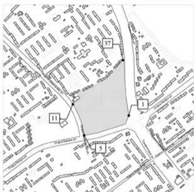
МАСШТАБ 1: 10 000

ПРИЛОЖЕНИЕ № 1 к распоряжению Департамента градостроительства городского округа Самара 19.01.2016 № РД-3