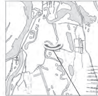
границы испрашиваемой территории

ПРИЛОЖЕНИЕ № 1 к распоряжению Департамента градостроительства городского округа Самара 27.09.2018 г. №РД-1504