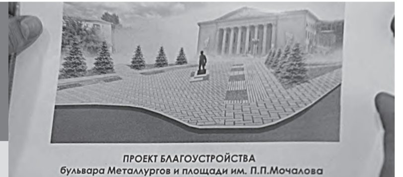
ПРОЕКТ БЛАГОУСТРОЙСТВА бульвара Metallurgov и площади им. П.П.Мочалова

- Сквер нуждается в реконструкции. Сейчас мы прораба-