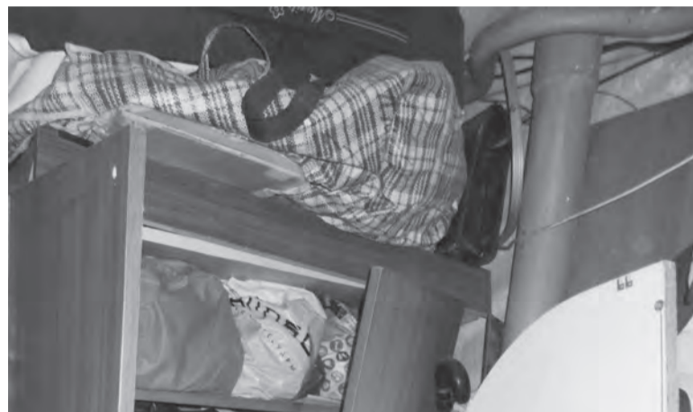
«Нехорошая» квартира такой была, когда здесь жил арендатор, а сегодня здесь все уже расчистили и идет ремонт