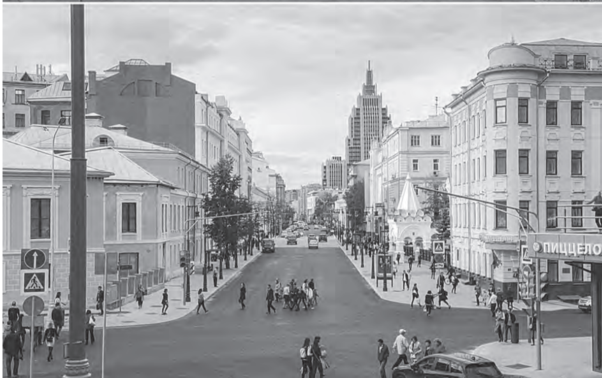
Малая Дмитровка в Москве до и после реновации. В работах участвовали самарские архитекторы.

но другое. Даже самый скромный энциклопедический обзор сильно меняет оптику.