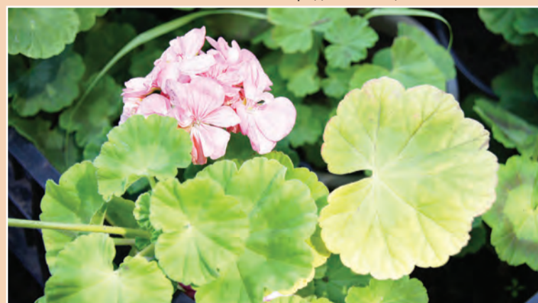
Подготовила Марина Гринева