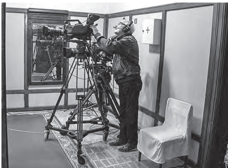
артист СССР Василий Лановой .

- Время надежно прячет следы даже сравнительно недавнего про-