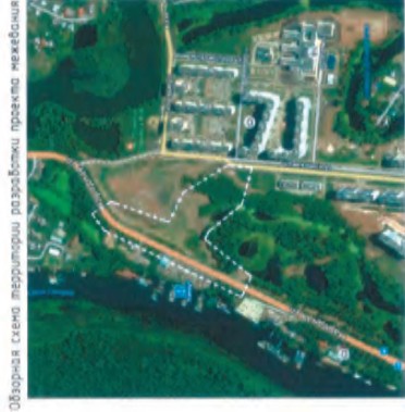
Общая схема территории размещения проекта жилищного строительства

Приложение №2 к Постановлению Администрации городского округа Самара от 17.01.2019 № 21