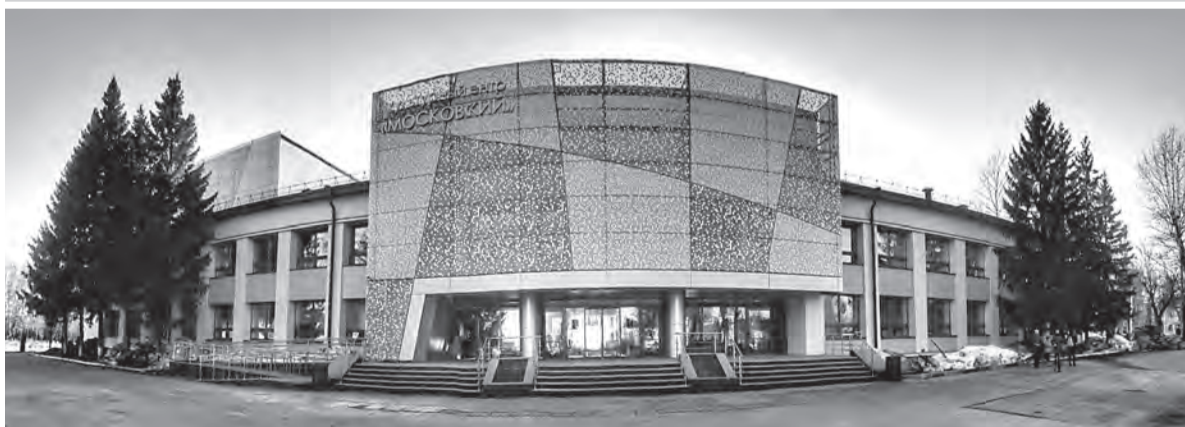
Культурный центр «Московский», Казань

ния исторических городов. Это те самые «исторические поселения», за статус которого сейчас борется, например, и Самара.