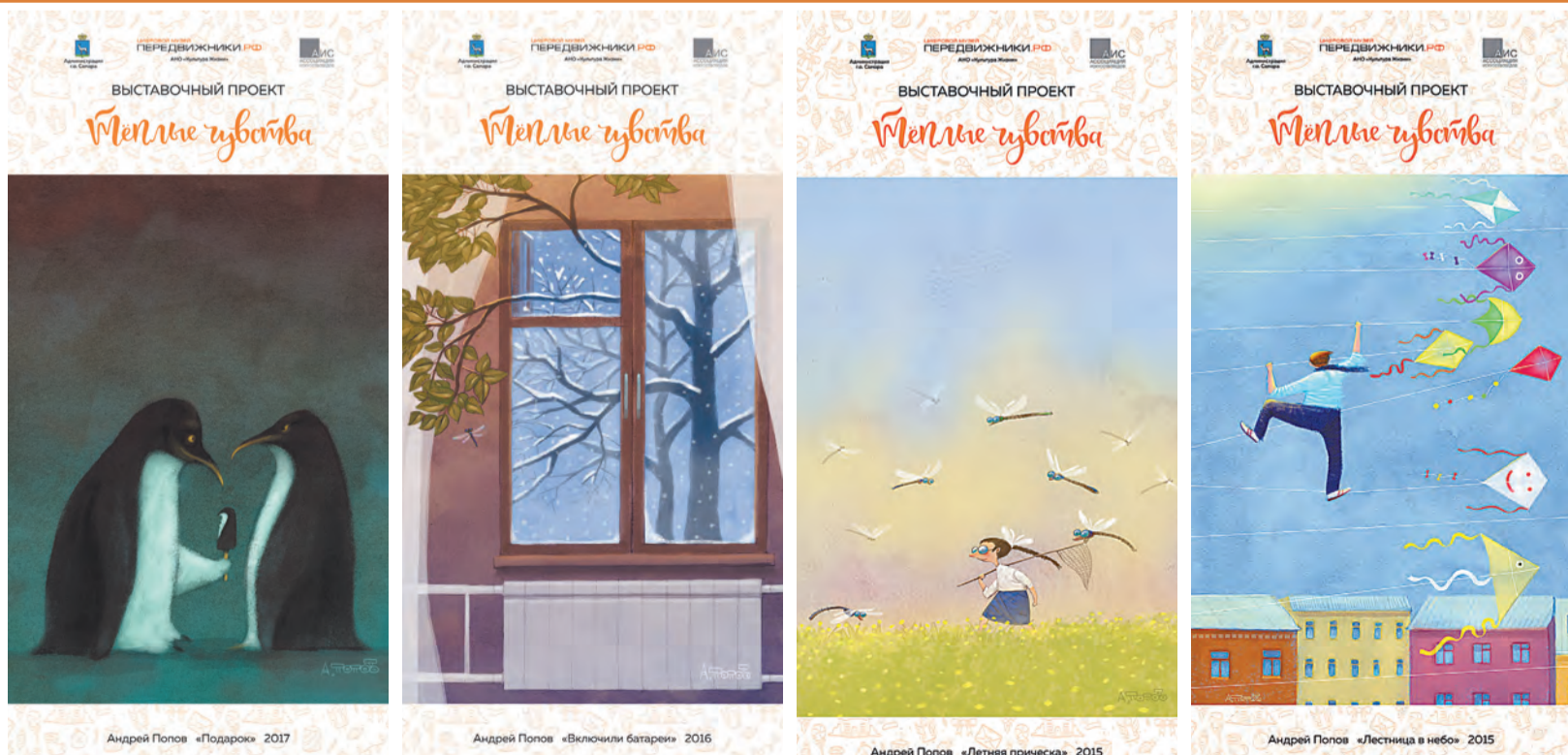
Андрей Попов «Подарок» 2017

На улицах Самары можно будет увидеть произведения современного искусства