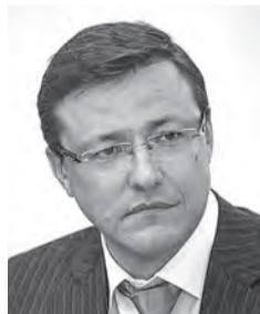
Дмитрий Азаров, ГУБЕРНАТОР САМАРСКОЙ ОБЛАСТИ: