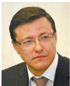
Дмитрий Азаров, ГУБЕРНАТОР САМАРСКОЙ ОБЛАСТИ:

Ракета-носитель «Союз» на площадке музейно-выставочного комплекса «Самара Космическая» прибыла к нам в город с космодрома Плесецк. Там она была учебной, на ней отработывались вывоз на старт, заправка и другие предпусковые операции. В Плесецке она выработала свой ресурс, и руководство ЦСКБ «Прогресс» добилось передачи ее нашему городу. Поскольку ракета имела боевой вариант, наши специалисты доработали ее под пилотируемый, и через некоторое время она заняла свое место рядом с музеем, став единственным в мире подобным экспонатом - вертикально установленной реально работавшей ракетой-носителем.