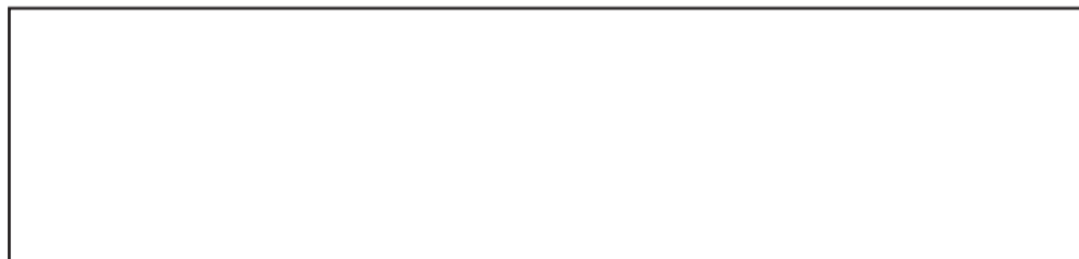
Схема установки и эксплуатации рекламной конструкции с указанием названий улиц и нумерации строений

ПРИЛОЖЕНИЕ 4 к Административному регламенту предоставления муниципальной услуги «Выдача разрешения на установку и эксплуатацию рекламных конструкций, монтируемых и располагаемых на внешних стенах, крышах и иных конструктивных элементах зданий, строений, сооружений, за исключением оград (заборов) и ограждений железобетонных, на территории Красноглинского внутригородского района городского округа Самара»