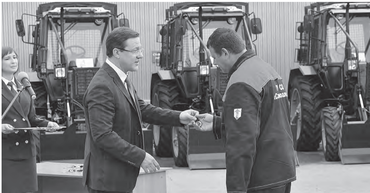
Пожарно-химические станции получили новые машины

- Пожароопасная ситуация в регионе остается очень непро-