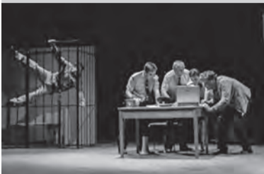
«ЧЕЛОВЕК ИЗ ПОДОЛЬСКА» (16+) «САМАРСКАЯ ПЛОЩАДЬ», 18.30