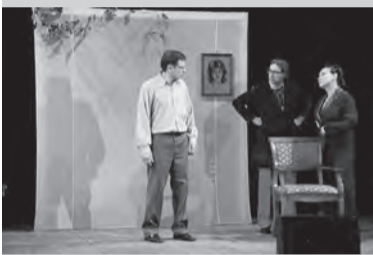
«ФЭН-ШУЙ» (детективная комедия) (12+) «САМАРСКАЯ ПЛОЩАДЬ», 18.30