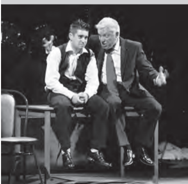
«ТЕСТОСТЕРОН» (комедия) (18+) «САМАРСКАЯ ПЛОЩАДЬ», 18.00