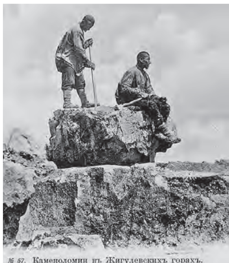
№ 57. Каменоломни в Жигулевских горах.