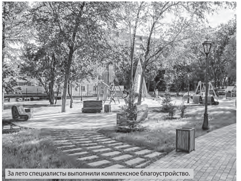
За лето специалисты выполнили комплексное благоустройство.