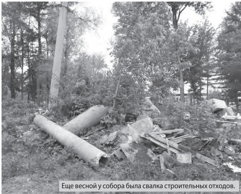
Еще весной у собора была свалка строительных отходов.

В сквере организовали интересное пространство. Здесь сделали дорожки - выложили их тротуар-