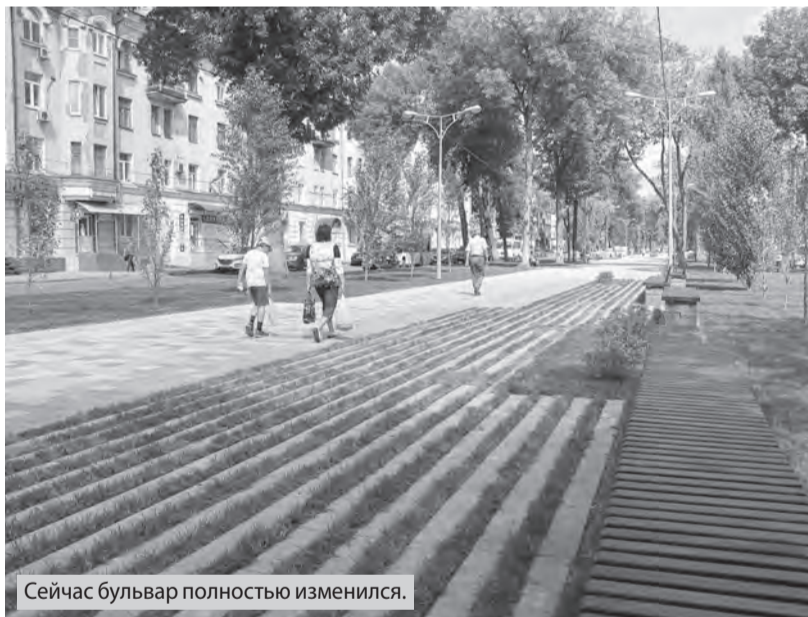
Сейчас бульвар полностью изменился.