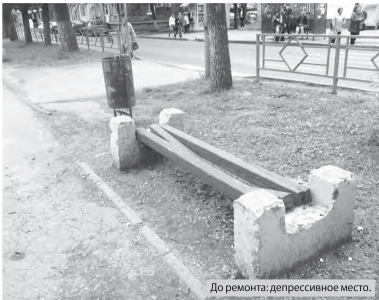
До ремонта: депрессивное место.

Как уточнил Плеханов, на этих территориях появилось плиточное покрытие на площади 18 тысяч квадратных метров. Проезжие части улиц Путьской и Строителей, там, где их пересе-