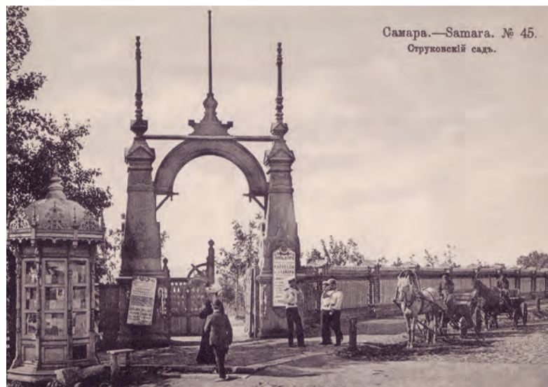
Самара.—Samara. № 45. Струковский сад.

В последние годы самарские праздники проходят очень организованно, на высшем уровне. И не только в центре, но и во всех районах города.