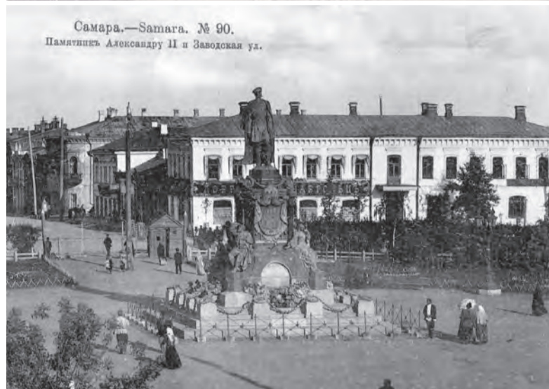
Самара.—Samara. № 90. Памятник Александру II и Заводская ул.