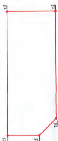
Схема границ зоны квартала (пл.-5.2293 га) и таблица координат поворотных точек красных линий