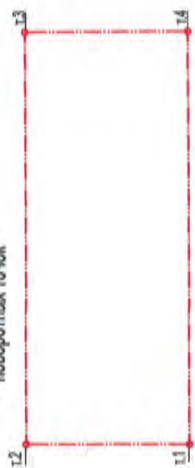
Схема границ земельного участка (пл.-5.8га), определенного для развития застроенной территории и таблица координат поворотных точек

ПРИЛОЖЕНИЕ № 2 к постановлению Администрации городского округа Самар от 03.09.2019 № 657-А