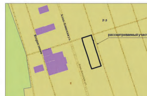
8. Земельный участок площадью 3070 кв.м по адресу: 17 км, Московское шоссе, "Ясная Поляна", линия 3. Изменение части зоны P-5 на зону Ц-2 (Заявитель – Семенов В.Е., Гражданкина И.А.)