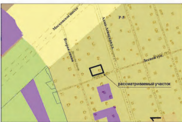
19. Земельный участок площадью 600 кв.м по адресу: ул. Алма-Атинская, участок 286. Изменение части зоны P-5 на зону Ц-2 (Заявитель – Белов А.А.)