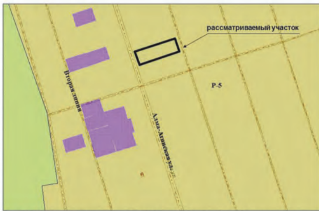
13. Земельный участок площадью 1188 кв.м по адресу: 17 км Московского шоссе. Изменение части зоны P-5 на зону Ц-2 (Заявитель – Мехтiev P.Ш.о.)