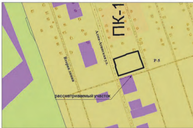
18. Земельные участки общей площадью 2654 кв.м по адресу: ул. Алма-Атинская, земельный участок расположен в южной части кадастрового квартала 63:01:0255003; ул. Алма-Атинская, участок 125. Изменение части зоны P-5 на зону Ц-2 (Заявитель – ЗАО «УППИ и КРС»)