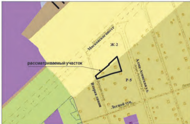
3. Земельные участки общей площадью 1317,6 кв.м по адресам: ул. Алма-Атинская, массив 17 км, участок № 1, массив 17 км. от з-да им. Масленикова, вторая линия, Участок № 2. Изменение части зоны P-5, Ж-2 на зону Ц-2 (Заявитель – Исаев Б.Н.о.)