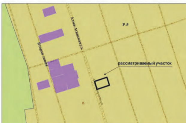
16. Земельный участок площадью 633 кв.м по адресу: ул. Алма-Атинская, участок № 139. Изменение части зоны P-5 на зону Ц-2 (Заявитель – Костюченко К.О.)