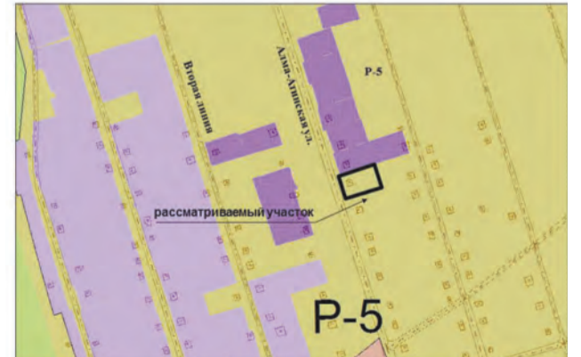
12. Земельный участок площадью 600 кв.м по адресу: "Ясная поляна", ул. Высоковольная/ Московское шоссе, участок 55/146. Изменение части зоны P-5 на зону Ц-2 (Заявитель – Валеев Р.И., Нугайбеков Ф.А.)