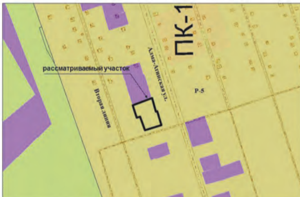
5. Земельные участки общей площадью 1200 кв.м по адресам: улица Алма-Атинская, массив 17 км, от завода имени Масленикова, участок № 37; 17 км з-да им. Масленикова, ул. Алма-Атинская, участок 39. Изменение части зоны P-5 на зону Ц-2 (Заявитель – Долгих А.П.)