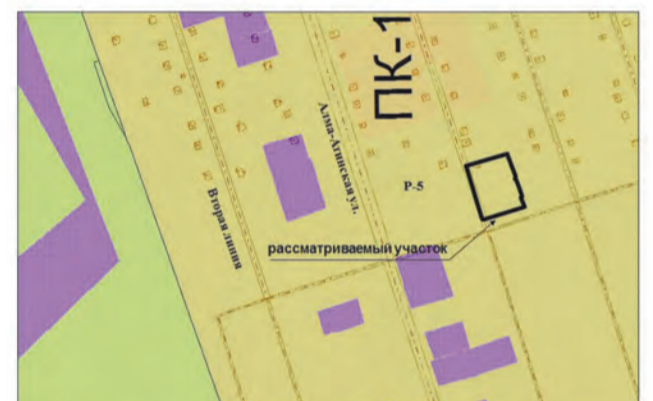
10. Земельный участок площадью 1321 кв.м по адресу: 17 км Московского шоссе, линия Третья, участок № 46, СТ КПО "ЗиМ". Изменение части зоны P-5 на зону Ц-2 (Заявитель – Федяшева Е.А.)