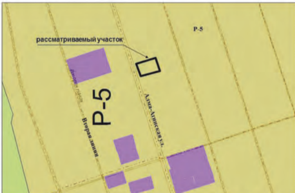
1. Земельный участок площадью 600 кв.м по адресу: Московское шоссе, 17 км, массив "Ясная Поляна", участок 88. Изменение части зоны P-5 на зону Ц-2 (Заявитель – Кинзябаев О.З.)