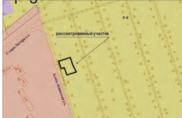
2. Земельные участки общей площадью 1047 кв.м по адресам: массив "Ветляное Озеро", ул. Алма-Атинская, линия 2, участок 174, ул. Алма-Атинская, массив "Ветляное озеро", 2-я линия, участок № 176, в составе ПСДК "Авиатор". Изменение части зоны P-5 на зону Ц-2 (Заявитель – Исаев К.Н.о.)