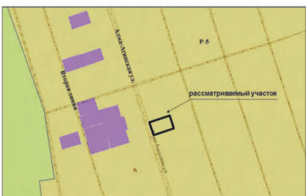
7. Земельный участок площадью 656,2 кв.м по адресу: ул. Алма-Атинская, участок 78. Изменение части зоны P-5 на зону Ц-2 (Заявитель – Семенов В.Е.)