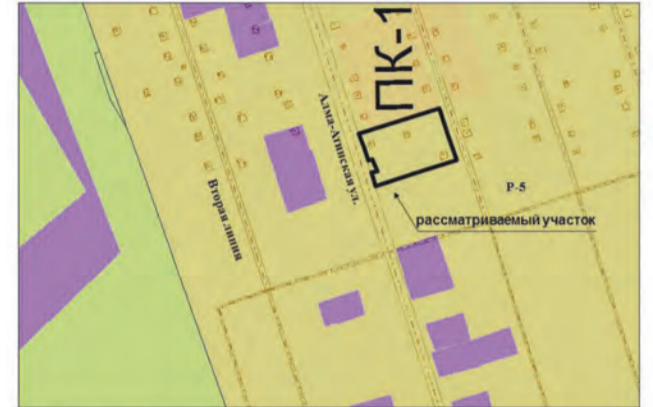
9. Земельные участки общей площадью 2427,5 кв.м по адресам: массив 17 км, ул. Алма-Атинская, от з-да им. Масленикова, участок 38; 17 км, участок № 37; массив 17 км., от завода им. Масленикова, ул. Алма-Атинская, участок № 40; 17 км. завода им. Масленикова, СТ ГПШ "ЗиМ", 3-я линия, участок № 39. Изменение части зоны P-5 на зону Ц-2 (Заявитель – Майоров Н.А.)