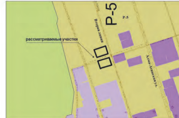
6. Земельные участки общей площадью 1213,3 кв.м по адресам: 17 км Московского шоссе, массив "Ясная Поляна"; 17 км, Московское шоссе, массив "Ясная поляна", участок № 279 А, в Кировском р-не. Изменение части зоны P-5 на зону Ц-2 (Заявитель – Рюмина Н.В., Волинщиков К.В.)