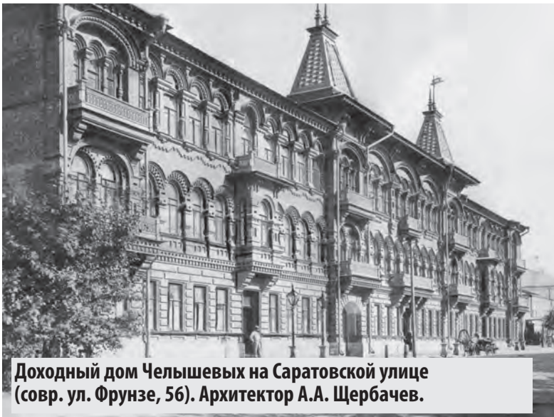
Доходный дом Челышевых на Саратовской улице (совр. ул. Фрунзе, 56). Архитектор А.А. Щербачев.