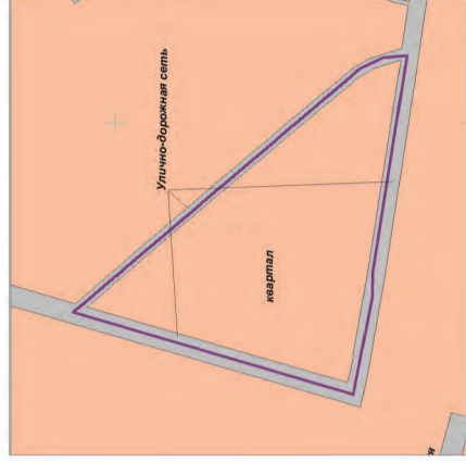
Схема расположения элементов планировочной структуры Масштаб 1:4000