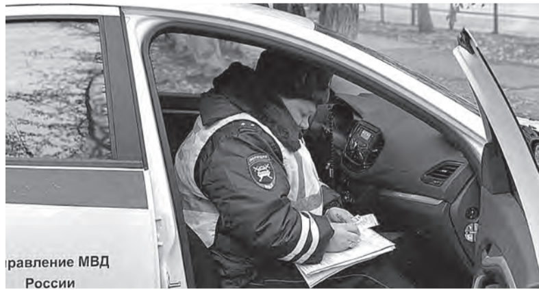
Управление МВД России

ральным законом обязанности по страхованию своей гражданской ответственности, а равно управление транспортным средством, если такое обязательное страхование заведомо отсутствует». Водитель-нарушитель будет оштрафован на 800 рублей.