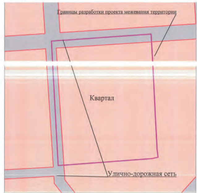
Схема расположения существующих элементов планировочной структуры