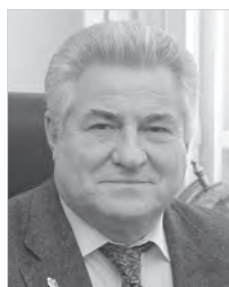
Геннадий Котельников, ПРЕДСЕДАТЕЛЬ САМАРСКОЙ ГУБЕРНСКОЙ ДУМЫ, АКАДЕМИК РАН:

07.00 Новогоднее развлекательное Шоу (12+) 07.30 Диалоги (12+) 08.00 ТНТ. Gold (16+) 10.00 Дом-2. Lite (16+) 11.15 Дом-2. Остров любви (16+) 12.30 Бородина против Бузовой (16+) 13.30 Дом-2. Спаси свою любовь (16+) 14.30, 15.00 Т/с «РЕАЛЬНЫЕ ПАЦАНЫ» (16+) 16.00 Т/с «УНИВЕР. НОВАЯ ОБЩАГА» (16+) 18.00, 19.00 Т/с «ИНТЕРНЫ» (16+) 19.30 ТВ. Новости (16+) 20.00 Т/с «САШАТАНЯ» (16+) 21.00 Т/с «ТРИАДА» (16+) 22.00 Где логика? (16+) 23.00 Т/с «КОРОЧЕ» (16+) 00.00 Дом-2. Город любви (16+) 01.05 Дом-2. После заката (16+) 02.05 Муз/ф «Мулен Руж» (12+) 04.25 Х/ф «ВОДИТЕЛЬСКИЕ ПРАВА» (16+) 05.45 Открытый микрофон (16+) 06.35 ТНТ. Best (16+)