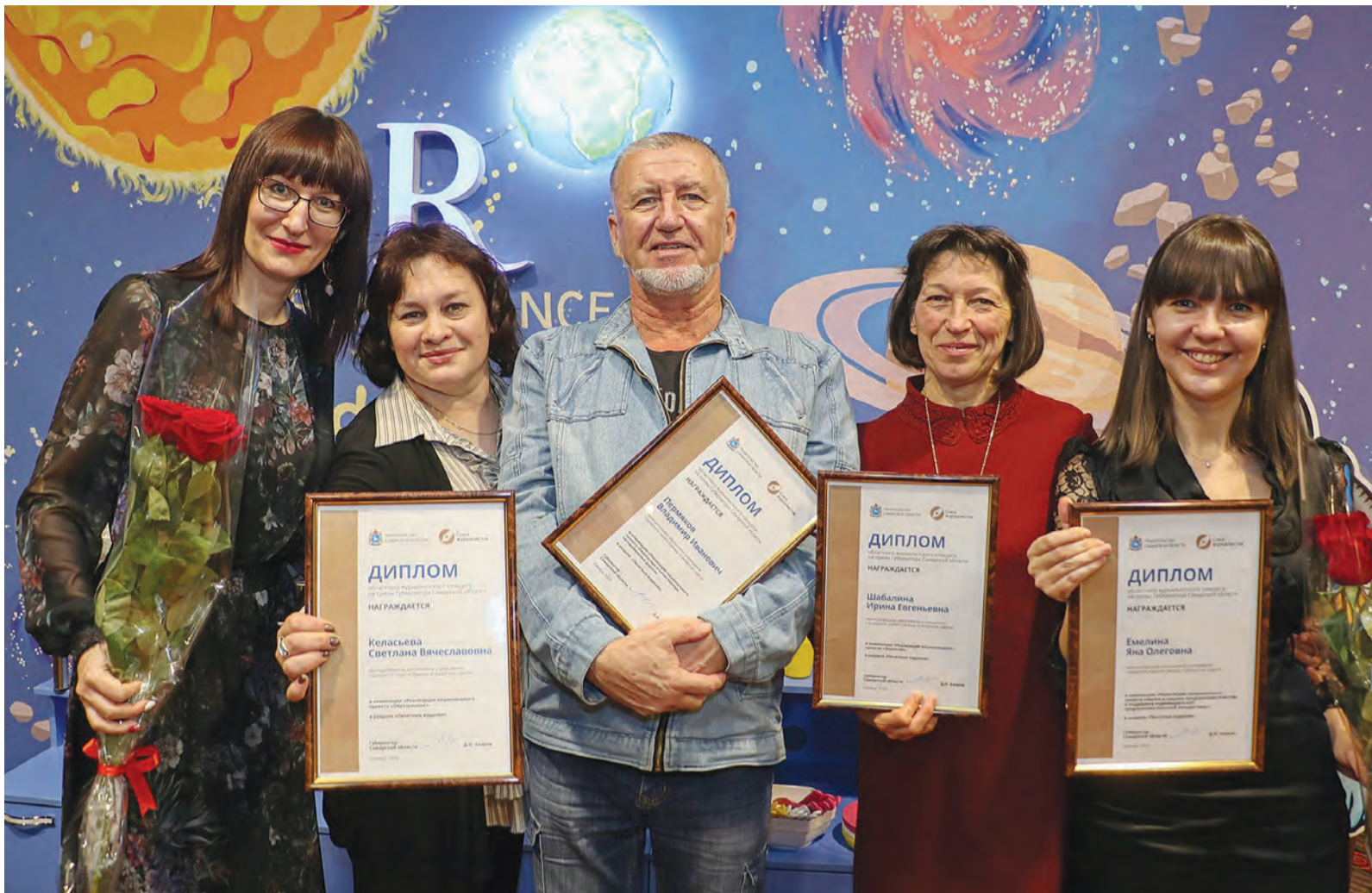
Четыре сотрудника «СГ» победили в конкурсе на призы губернатора

- Успехов в реализации нацпроектов можно достичь только благодаря вовлечению максимального количества граждан, проведению грамотной информационной работы, которая покажет людям, что конкретно им могут дать нацпроекты, - сказал Азаров. - Заметные достижения у нас есть во многом благодаря вашему участию. Именно вы можете поддержать интерес к тому или иному направлению. Не всегда у чиновников это получается хорошо. Часто, объясняя людям, для чего тот или иной нацпроект, как в нем по-