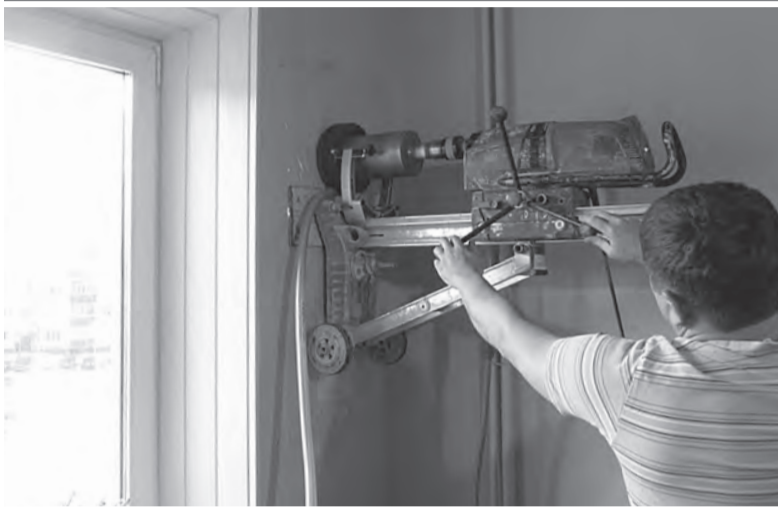
Установка приточного оконного или стенового клапана в помещении, где эксплуатируется газовое оборудование, может спасти жизнь.

Беспечность при использовании газовых приборов приводит к проблемам со здоровьем и даже к смерти