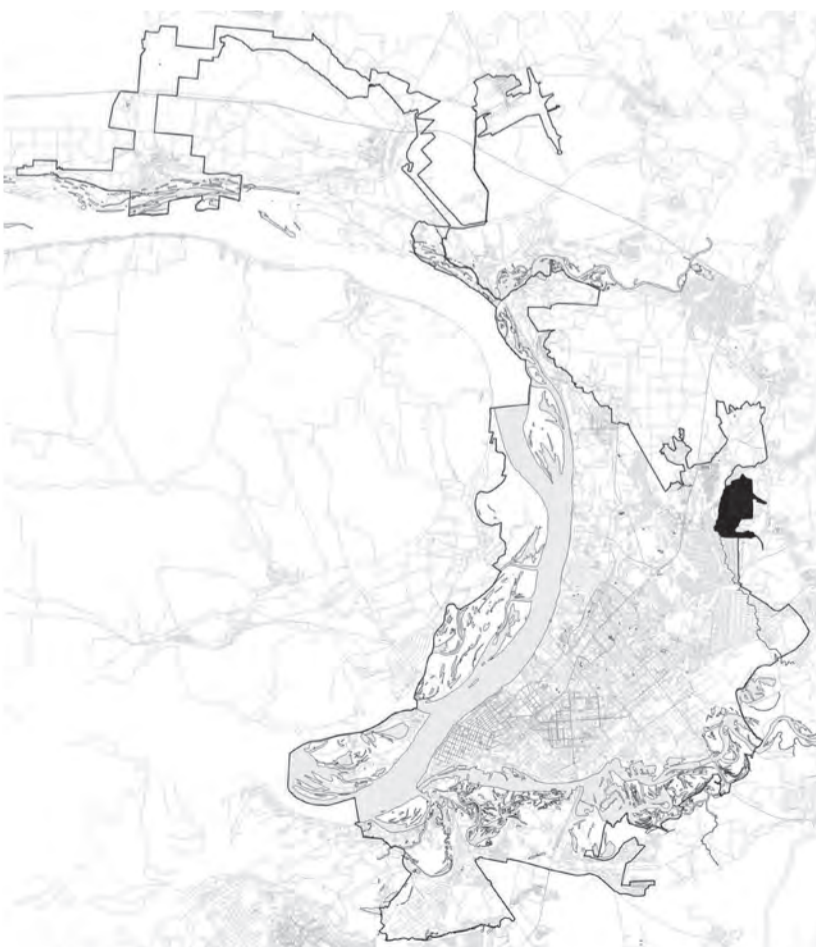
Схема части территории городского поселения Смышляевка муниципального района Волжский Самарской области, предлагаемой ко включению в границы муниципальных образований городского округа Самара Самарской области и Красноглинского внутригородского района городского округа Самара Самарской области

Схема изменения границ муниципальных образований городского округа Самара Самарской области, Красноглинского внутригородского района городского округа Самара Самарской области, муниципального района Волжский Самарской области, городского поселения Смышляевка муниципального района Волжский Самарской области