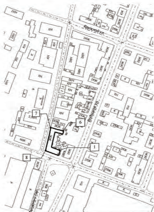
СХЕМА расположения земельного участка, занимаемого МКД, признанного аварийным, по адресу: ул.Максима Горького, д. 11