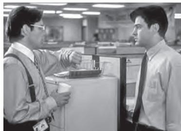
«Офисное пространство» (16+)

В фильме рассказывается о жизни работников компании Initech. После неудачного сеанса гипноза главный герой Питер, который считался неэффективным сотрудником, решает вовсе «забыть» на работу. Он приходит в офис только для того, чтобы играть в компьютерные игры. Но подобные действия, как ни странно, только поднимают его авторитет, зарплату и должность. Используя новые возможности, он решает заразить бухгалтерскую систему вирусом и присвоить чужие деньги.