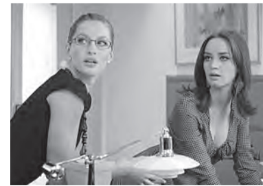
«Дьявол носит Prada» (16+)

Это история о жизни провинциальной девушки Энди. После окончания университета она получает должность помощницы Миранды Пристли, деспотичного редактора одного из крупнейших нью-йоркских журналов мод. Энди всегда мечтала о такой работе, но личная жизнь постепенно начинает рушиться.