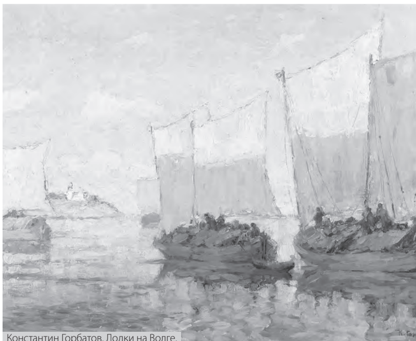
Константин Горбатов. Лодки на Волге.