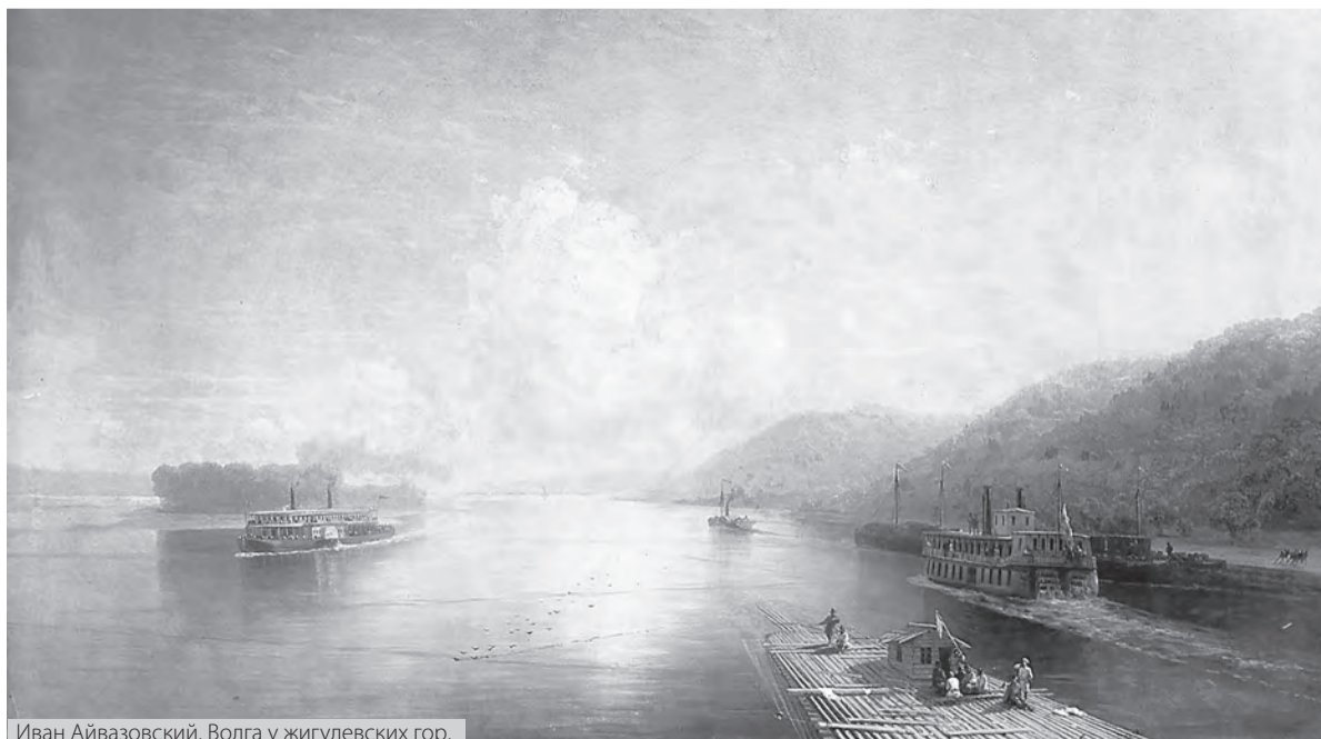
Иван Айвазовский. Волга у жигулевских гор.