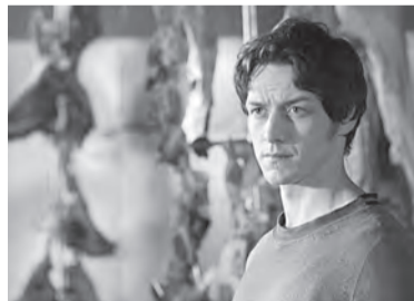
«Особо опасен» (18+)

Главным героем фильма является Уэсли Гисон, у которого скучная и однообразная жизнь. Работает он на небольшую компанию и никак не научится противостоять нападкам своего начальника. Но неожиданно Уэсли оказывается втянутым в тайное общество киллеров под названием «Братство». За его обучение берется опытная наставница Фокс.