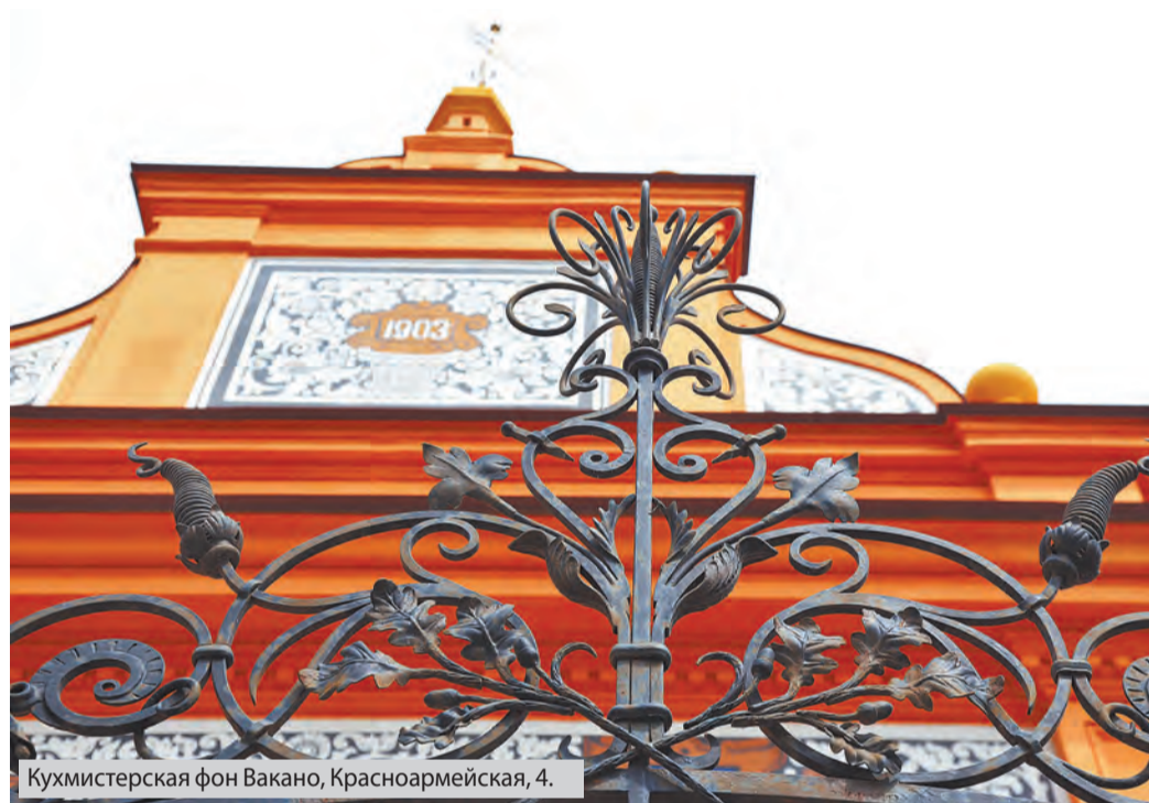
Кухмистерская фон Вакано, Красноармейская, 4.