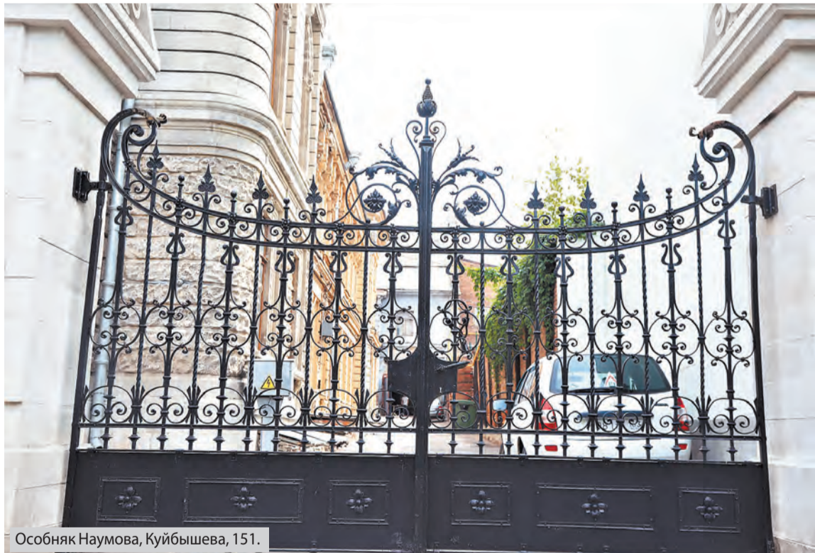
Особняк Наумова, Куйбышева, 151.