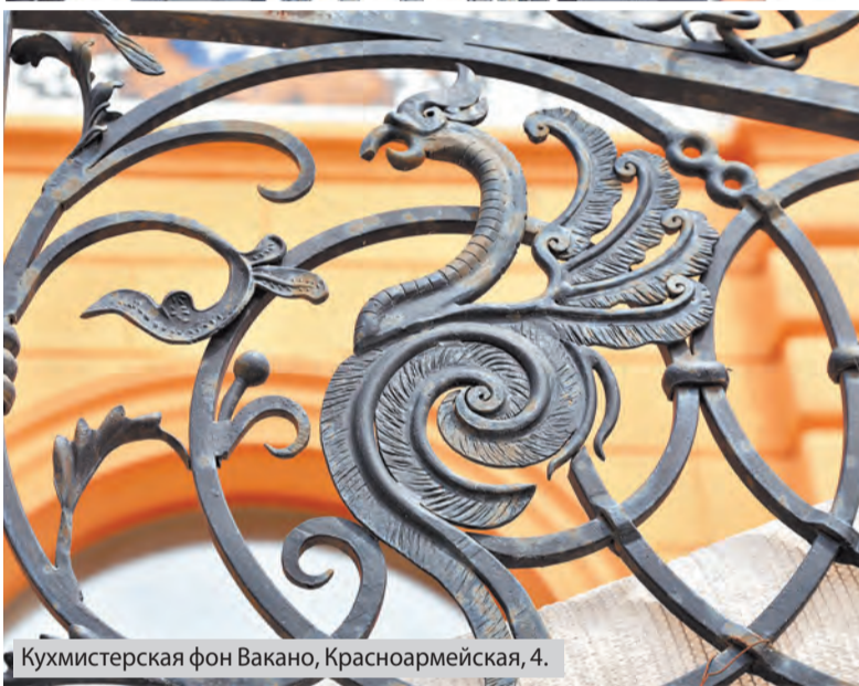
Кухмистерская фон Вакано, Красноармейская, 4.

к бабочкам прослеживаются в оформлении калитки, ограды и парапета кровли.