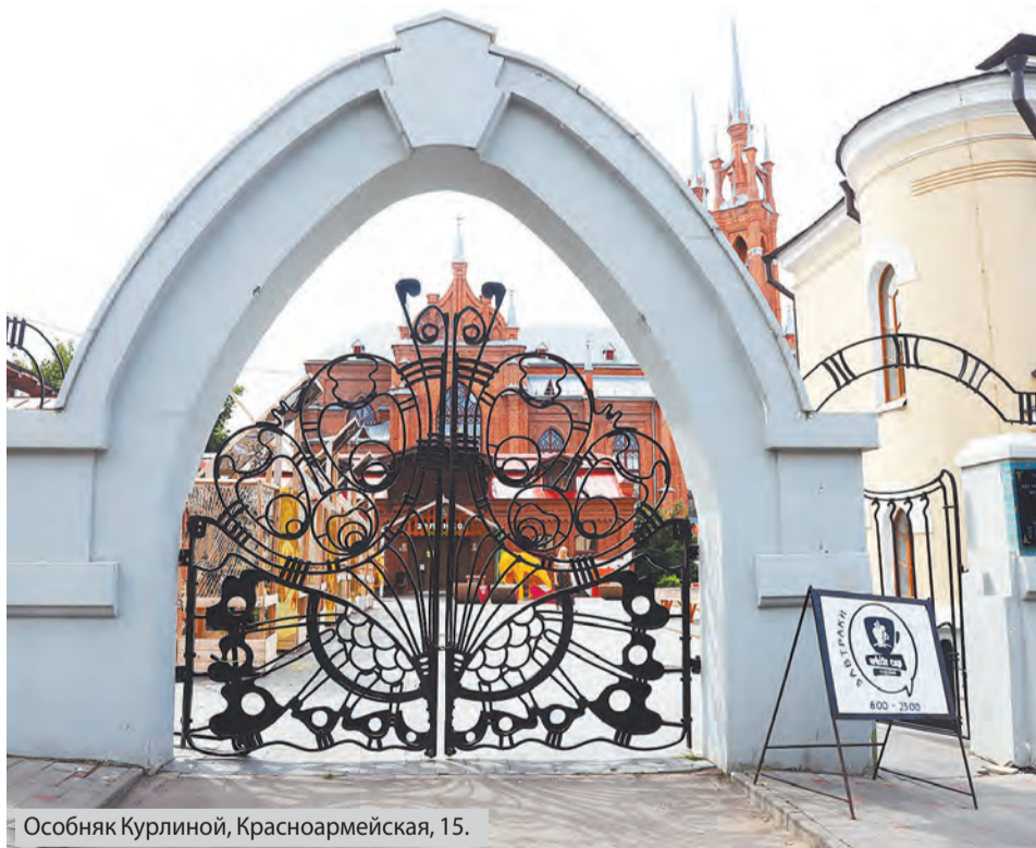
Особняк Курлиной, Красноармейская, 15.