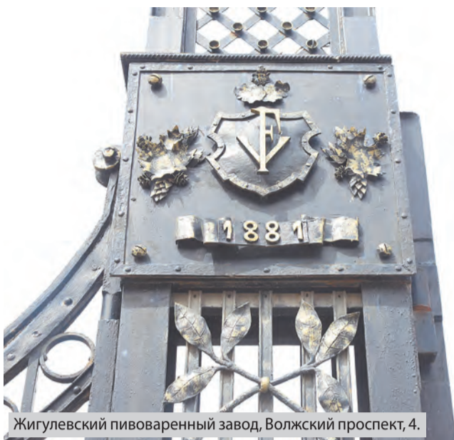
Жигулевский пивоваренный завод, Волжский проспект, 4.

- Металл - это нетленная классика, отсылающая к прошлым векам, к купечеству. Если посмотреть на некоторые объекты того времени - те же кованые ворота пивзавода, - нельзя сказать, что они были выполнены очень искусно. Там есть некоторые ляпы. Но нужно понимать, когда это было сделано и для кого. Сейчас кузнецы больше внимания уделяют визуальной части, а раньше в приоритете были другие задачи. Основной упор делали на фасад здания, чтобы добиться общей красивой картинкой. Если взглянуть на архитектуру Санкт-Петербурга, то там можно заметить просто потрясающие вещи. Но это культурная столица. Самара все-таки немного отставала от нее в плане эстетического развития.