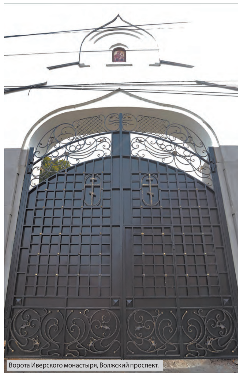
Ворота Иверского монастыря, Волжский проспект.

вывалась на чистой геометрической форме, неотделимой от концепции «нового стиля». В новой версии форма немного изменилась, как и сама конструкция, - нижняя часть была сделана из сплошного металла, а не из прутьев. Сходство с оригиналом прослеживается только в высокой верхней дуге и острых пиках. За воротами теперь находится здание УФСБ.