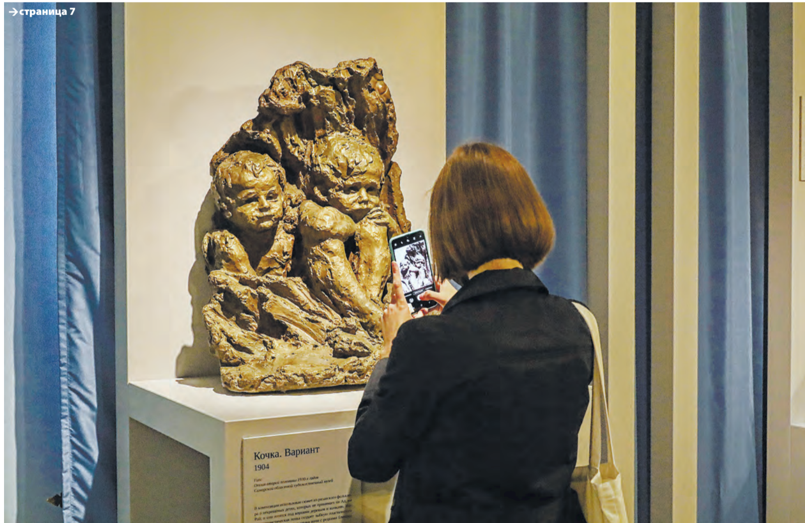
Кочка. Вариант 1904

Титул: Кочка. Вариант 1904 Самарский областной художественный музей