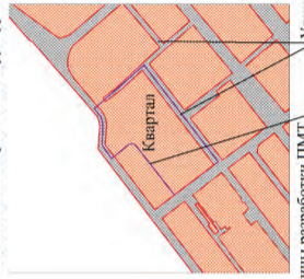
Границы разработки ПМТ