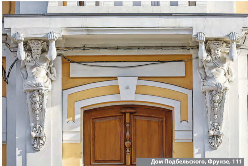
Дом Подбельского, Фрунзе, 111