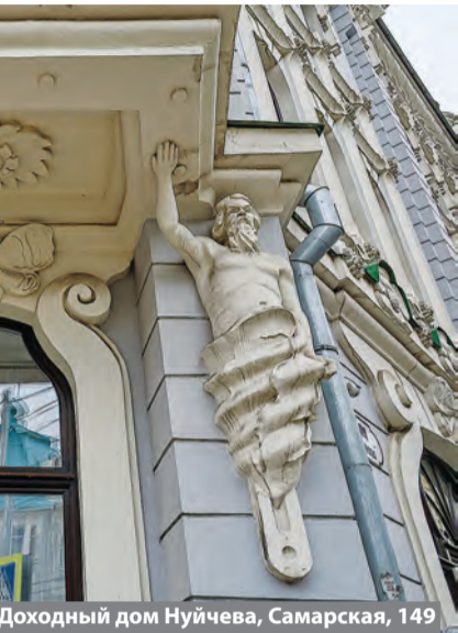
Доходный дом Нуйчева, Самарская, 149