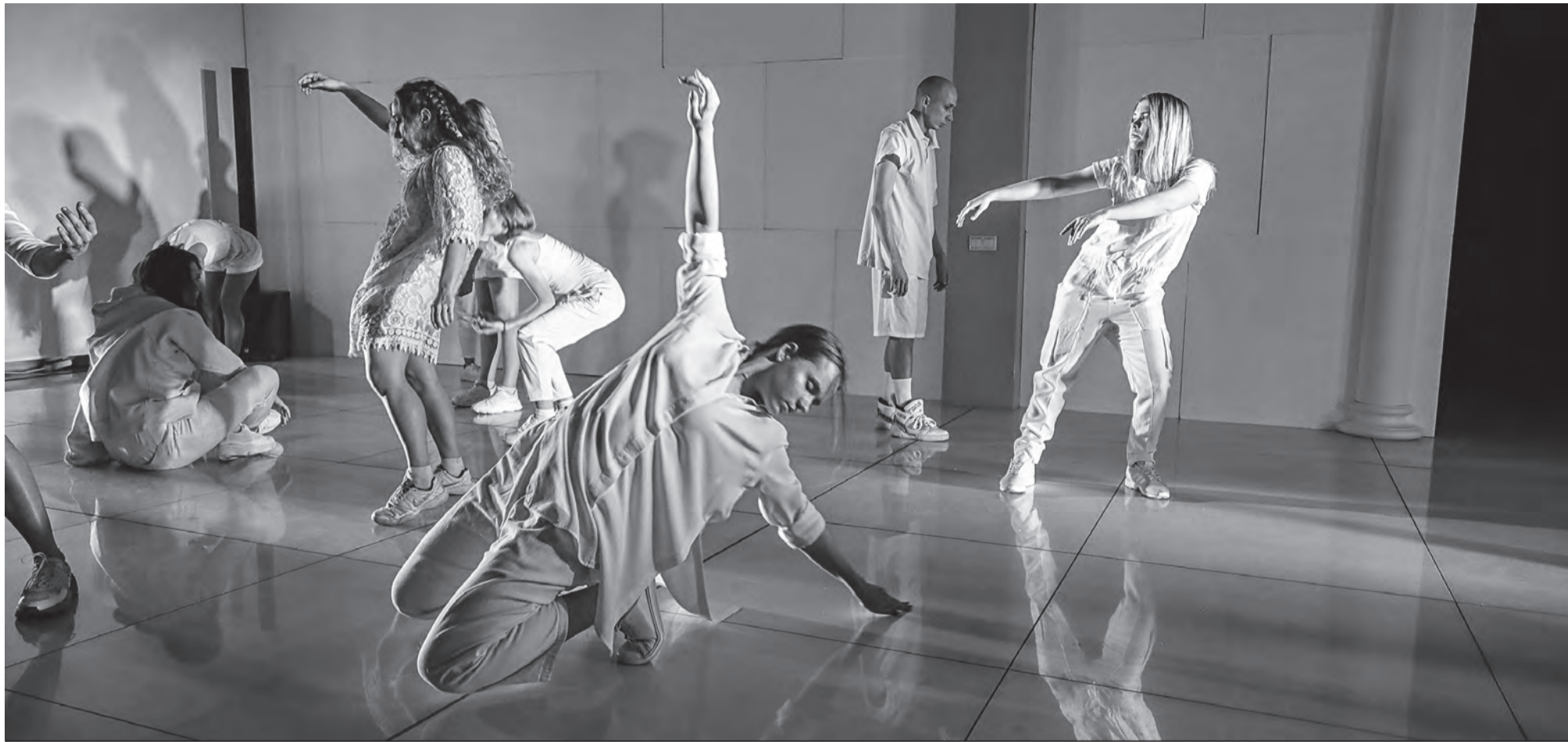
ПРОЕКТ Экспериментальная постановка

Галерея «Виктория» решилась на необычный эксперимент. В ее стенах состоялась премьера хореографического спектакля по мотивам романа Алексея Толстого «Хождение по мукам» (18+). Это необычный опыт для галереи, занимающейся преимущественно изобразительным искусством, но логичный шаг для осуществляемого здесь проекта «Дворец культуры».