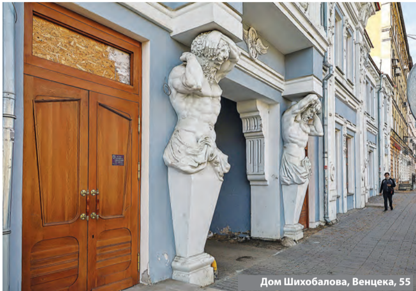
Дом Шихобалова, Венцека, 55