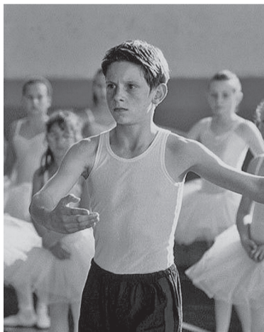
«Билли Эллиот» (16+)

Лента рассказывает о сыне шахтера, которого отдали на бокс, тогда как сам он влюблен в балет. Мальчик решает следовать своей мечте. Отец и старший брат Билли впадают в ярость, когда узнают о его решении. Но Эллиота поддерживает учительница, и он получает шанс поступить в Королевскую балетную школу.