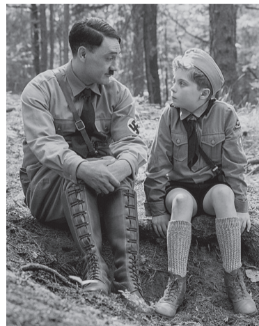
Павел Деревянко и Юрий Колоколников.