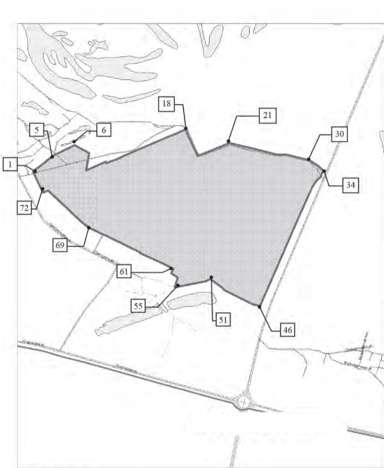
СХЕМА границ территории для подготовки документации по планировке территории (проекта планировки и проекта межевания территории) в границах улицы Центральной, перспективной магистрали общегородского значения и Южного шоссе в Куйбышевском районе городского округа Самара

ПРИЛОЖЕНИЕ № 1 к распоряжению Департамента градостроительства городского округа Самара 30.11.2020 №РД-1471