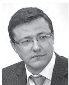
Дмитрий Азаров, ГУБЕРНАТОР САМАРСКОЙ ОБЛАСТИ:

- Я очень ждала 18-летия, потому что хотела совершать дела, полезные для людей, - объясняет девушка. - Каждый человек может в какой-то момент жизни нуждаться в донорской крови. Бывают разные ситуации: и аварии, и кровотечения, и травмы. Я сдаю кровь по четыре раза в год и желаю всем людям помогать своим ближним и приходить на станцию переливания крови.