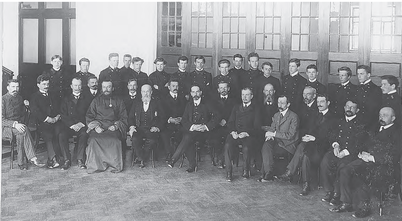
Самара.—Samara. № 5. Коммерческое училище.