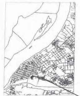
месторасположение земельного участка

Приложение к Постановлению Администрации городского округа Самара от 02.02.2021 № 55