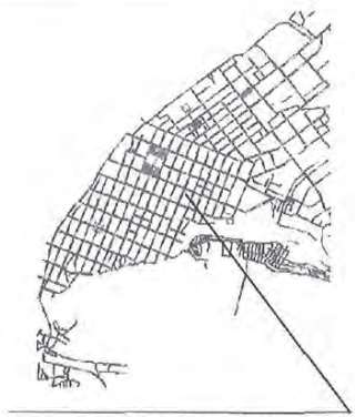
месторасположение земельного участка МАСШТАБ 1:80000

Приложение к Постановлению Администрации городского округа Самара от 01.02.2021 № 48