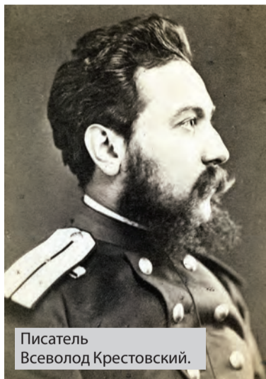
Писатель Всеволод Крестовский.

“ Рыжий мужчина, по-видимому, отставной солдат, бил полупьяную женщину. Зрители поощряли его хохотом. Полицейский на углу пребывал в олимпийском спокойствии... Все это показалось мне дико и ново. Что это за жизнь, что за нравы, какие это женщины, какие это люди? Я решился переступить порог того гнилого, безобразного приюта... Вырученная своими товарками окровавленная женщина с воем металась по низенькой, тесной комнате, наполненной людьми, плакала и произносила самые циничные ругательства, мешая их порою с французскими словами и фразами. Это обстоятельство меня заинтересовало.