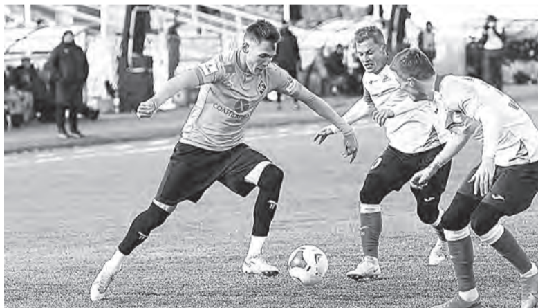
«Крылья Советов» (Самара) - «Иртыш» (Омск) - 3:1 (2:1).