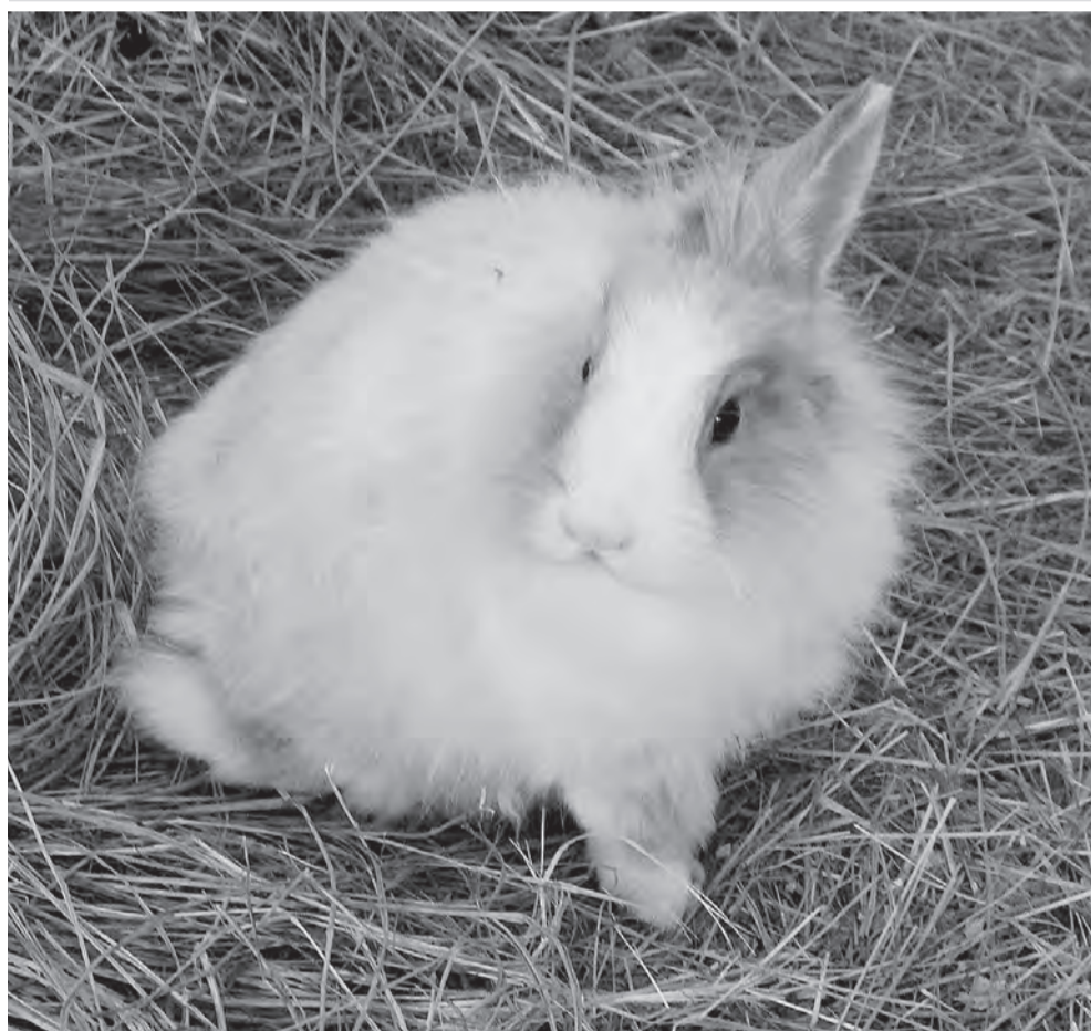
Кролик с дачи и крыса из общаги

В детском эколого-биологическом центре можно пообщаться с животными и приобрести домашнего питомца