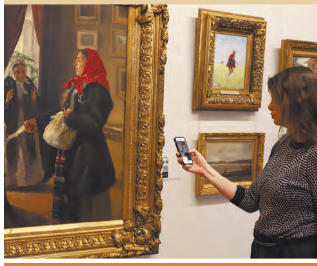
Подготовила Светлана Келасьева

Также для детей будут организованы праздничные программы, посвященные Дню России, Дню любви, семьи и верности и прочим знаковым датам.