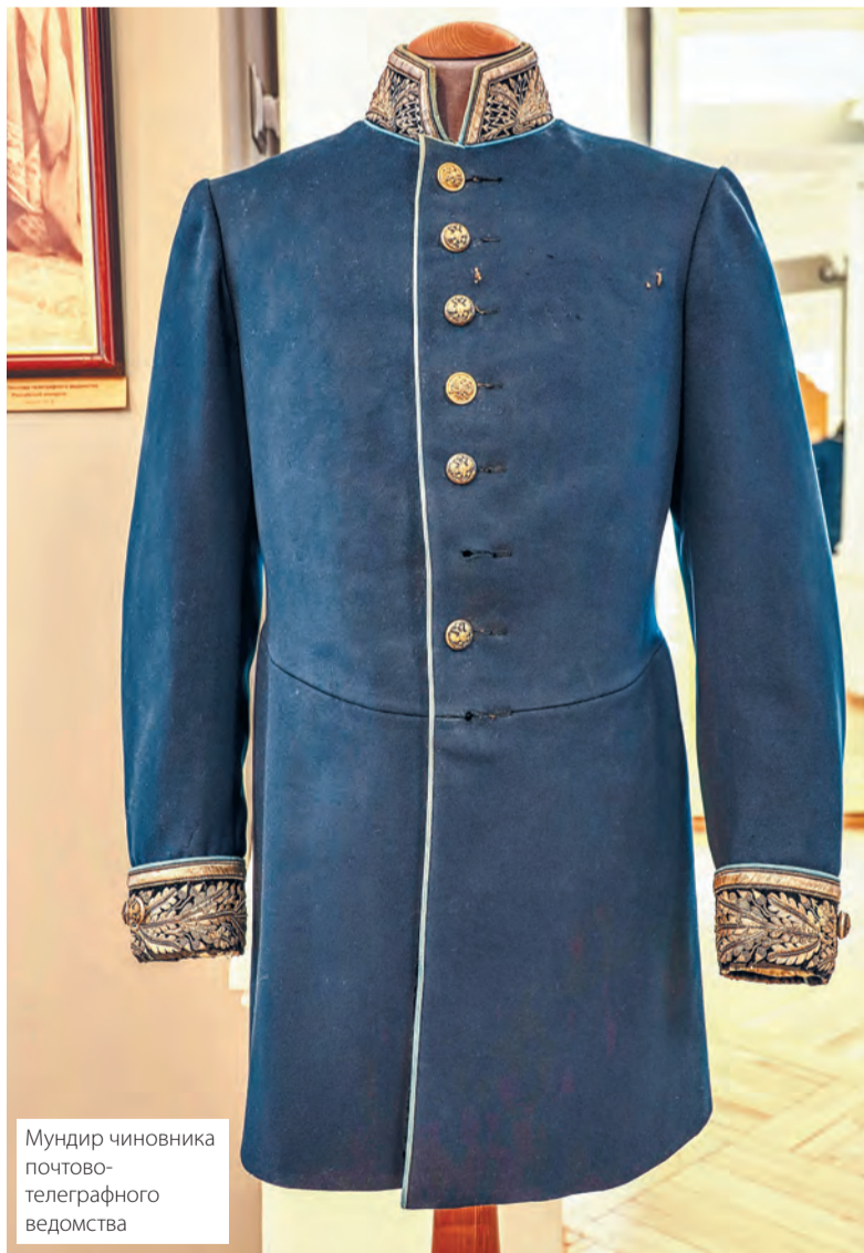
Мундир чиновника почтово-телеграфного ведомства