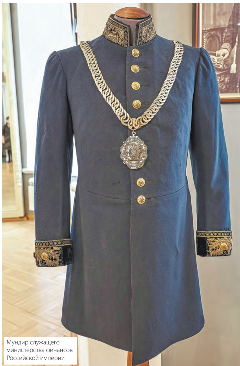
Мундир служащего министерства финансов Российской империи