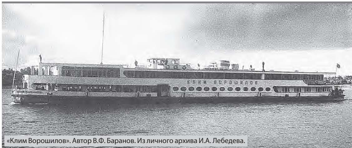
«Клим Ворошилов». Автор В.Ф. Баранов.